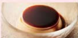
なめらか和プリン [黒蜜ソース]