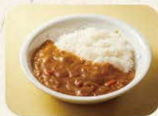
お子様カレー 380円(税込418円)