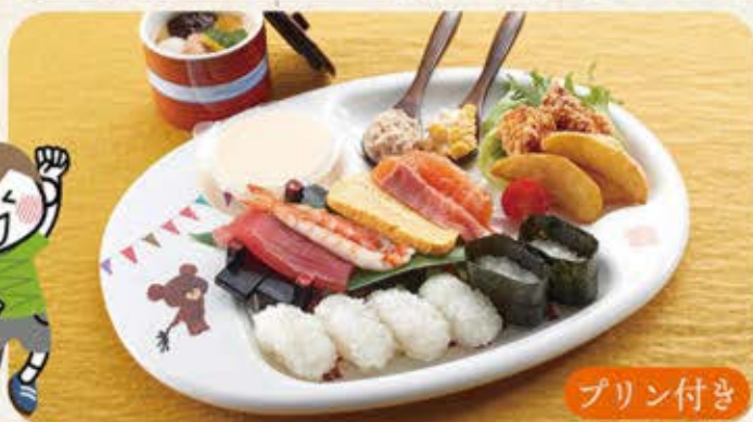
板前寿司セット(いたまえすしセット) 780円(税込858円)