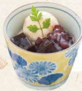
コーヒーゼリー 善哉 450円(税込495円)