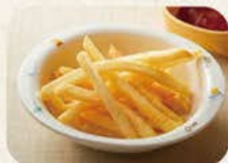
ミニポテトフライ 230円(税込253円)