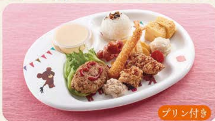
お子様ランチ(おこさまランチ) 600円(税込660円)