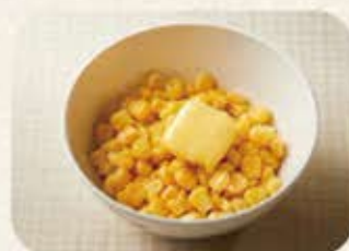
バターコーン 280円(税込308円)