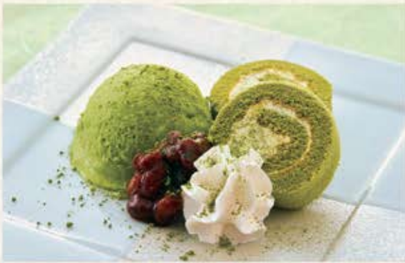
宇治抹茶の甘味寄せ 450円(税込495円)