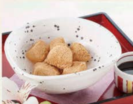
わらびもち 380円(税込418円)