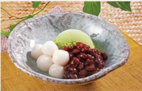
宇治抹茶白玉 450円(税込495円)