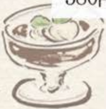
コーヒーゼリー 380円(税込418円)