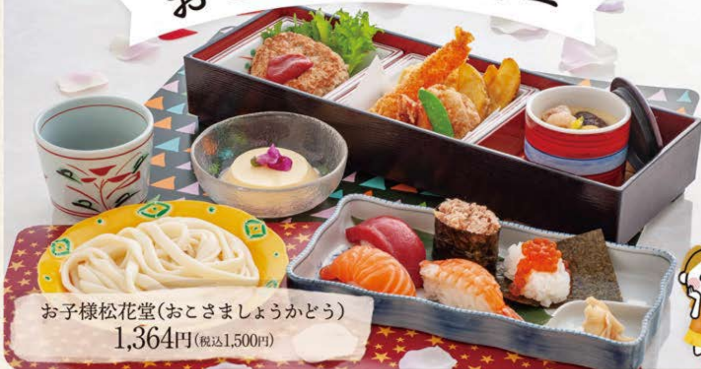
お子様松花堂(おこさましょうかどう) 1,364円(税込1,500円)