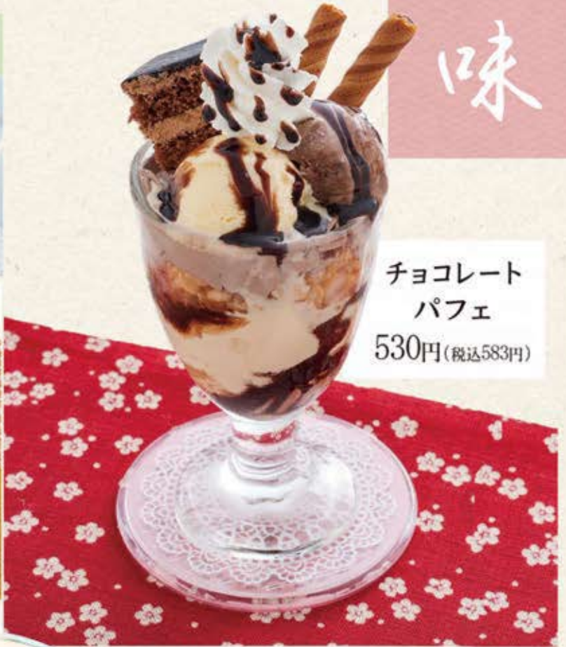
チョコレート パフェ 530円(税込583円)