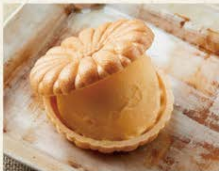
アイスクリーム (バニラ・宇治抹茶・チョコレート) 各280円(税込308円)