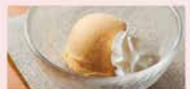
アイスクリーム [バニラ/宇治抹茶/チョコ]