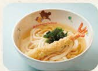
お子様うどん 380円(税込418円)